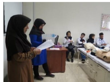
قرنطینه قبل از آزمون