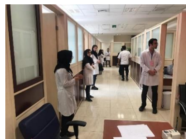
اعلام زمان شروع آزمون