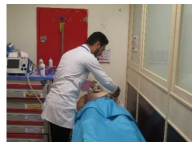
تصویری از ایستگاه های فعال