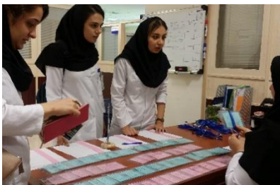
تحویل کارت ورود به آزمون