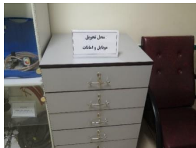
محل حضور غیاب و تحویل امانات