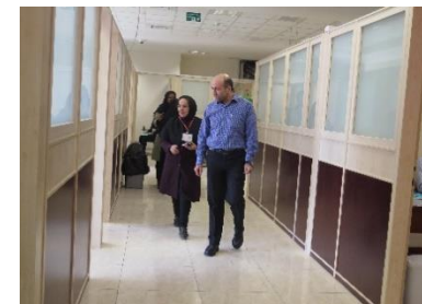
بازدید مسئولین از ایستگاههای آزمون