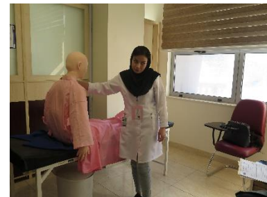
تصویری از ایستگاه های فعال