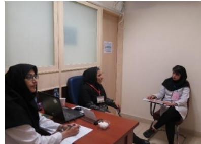
تصویری از ایستگاه های فعال