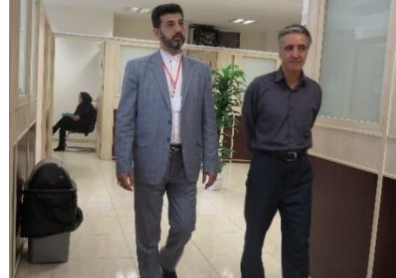
استقرار مسئولین در محل ایستگاههای آزمون