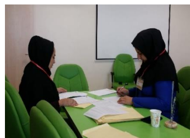
جمع بندی نمرات