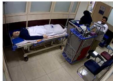
آماده سازی محل برگزاری آزمون