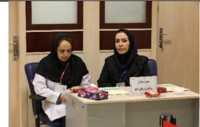
مراقب و زمان سنج