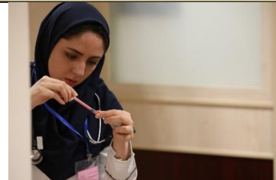
تصویری از ایستگاه های فعال