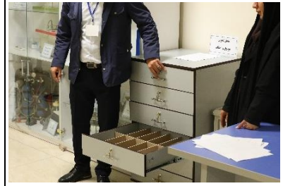
محل حضور غیاب و تحویل امانات