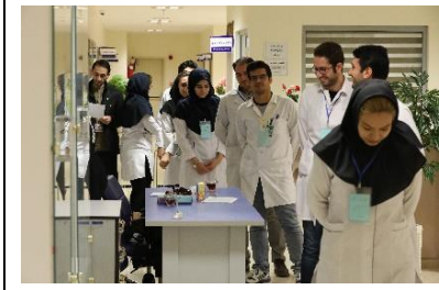
ورود شرکت کنندگان به محل برگزاری آزمون