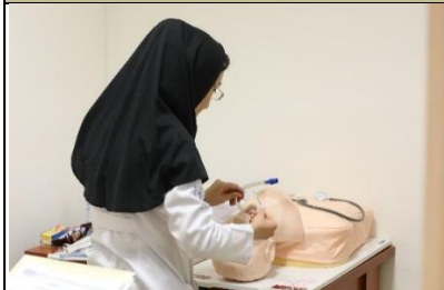
تصویری از ایستگاه های فعال