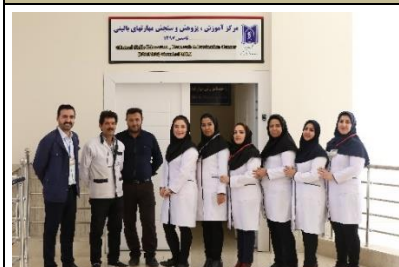
کمیته ی اجرایی آزمون