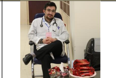
تصویری از ایستگاه های استراحت