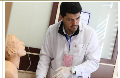
تصویری از ایستگاه های فعال