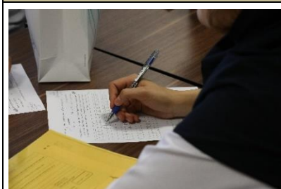
قرنطینه بعد از آزمون