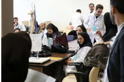
قرنطینه قبل از آزمون