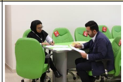
جمع بندی نمرات