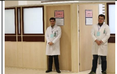
اعلام زمان شروع آزمون